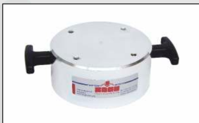
150 mm Lastplatte Erweiterung des Messbereiches (Evd 70-140 MN/m 2 )