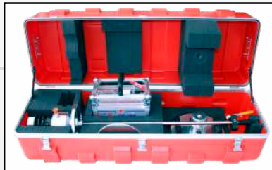
Transportkiste Sicherer und sauberer Transport und Aufbewahrung der Messgeräte