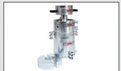
CBR Laborversuch, dynamisch