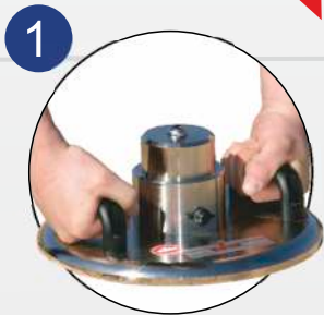
1. Lastplatte auflegen