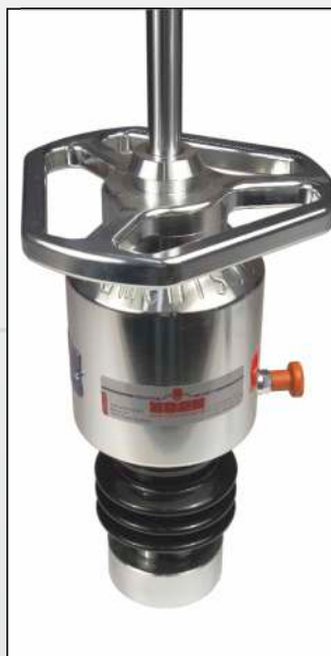
15 kg Belastungsvorrichtung 1,5 fache Stoßbelastung (Evd 70-105 MN/m 2 )