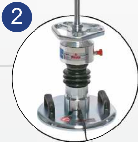
2. Gewicht aufsetzen