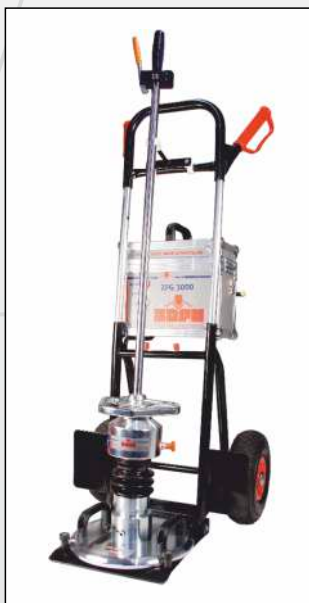
klappbarer Transportwagen Leichter Transport auf jeder Baustelle