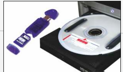
Software für XP, Vista und Win7 inkl. USB-SD-Adapter