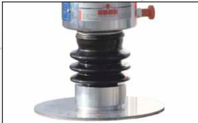
Magnetstandfuß Sauberes Abstellen der Mechanik im Feld während der Ausrichtung der Lastplatte