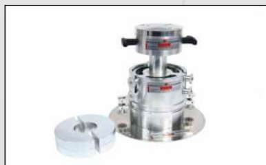
CBR Feldversuch, dynamisch