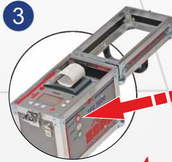
3. Gerät einschalten