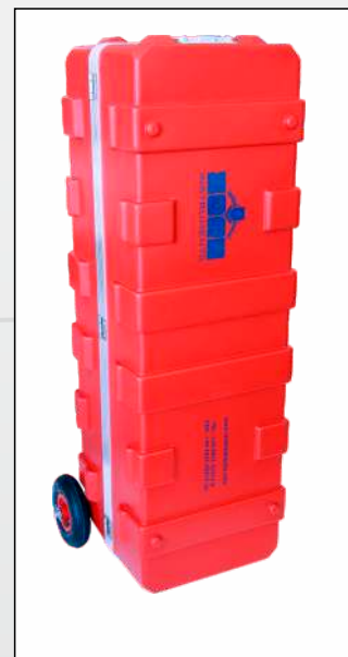
Transportkiste optional mit Rädern