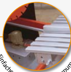
Einfacher Zugang zur Wasserpumpe.